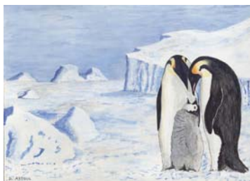
Document 2 Carte Premier-jour Protection des pôles avec le timbre « Manchots empereurs » du bloc. Dessin Daniel Astoul