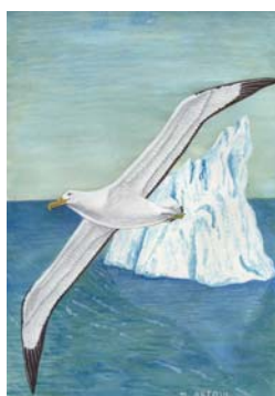
Document 3 Carte Premier-jour Protection des pôles avec le timbre « Paysage polaire » du bloc. Dessin Daniel Astoul