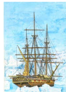
Document 4 Carte navire Astrolabe avec oblitération Bureau Temporaire Escales Polaires ci-dessous sur timbre « Astrolabe » de France (2008). Dessin Daniel Astoul